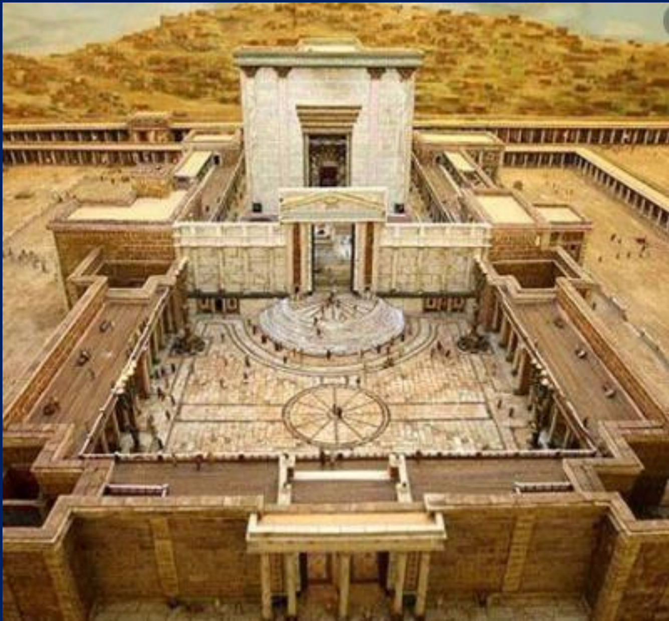
Salomo se tempel