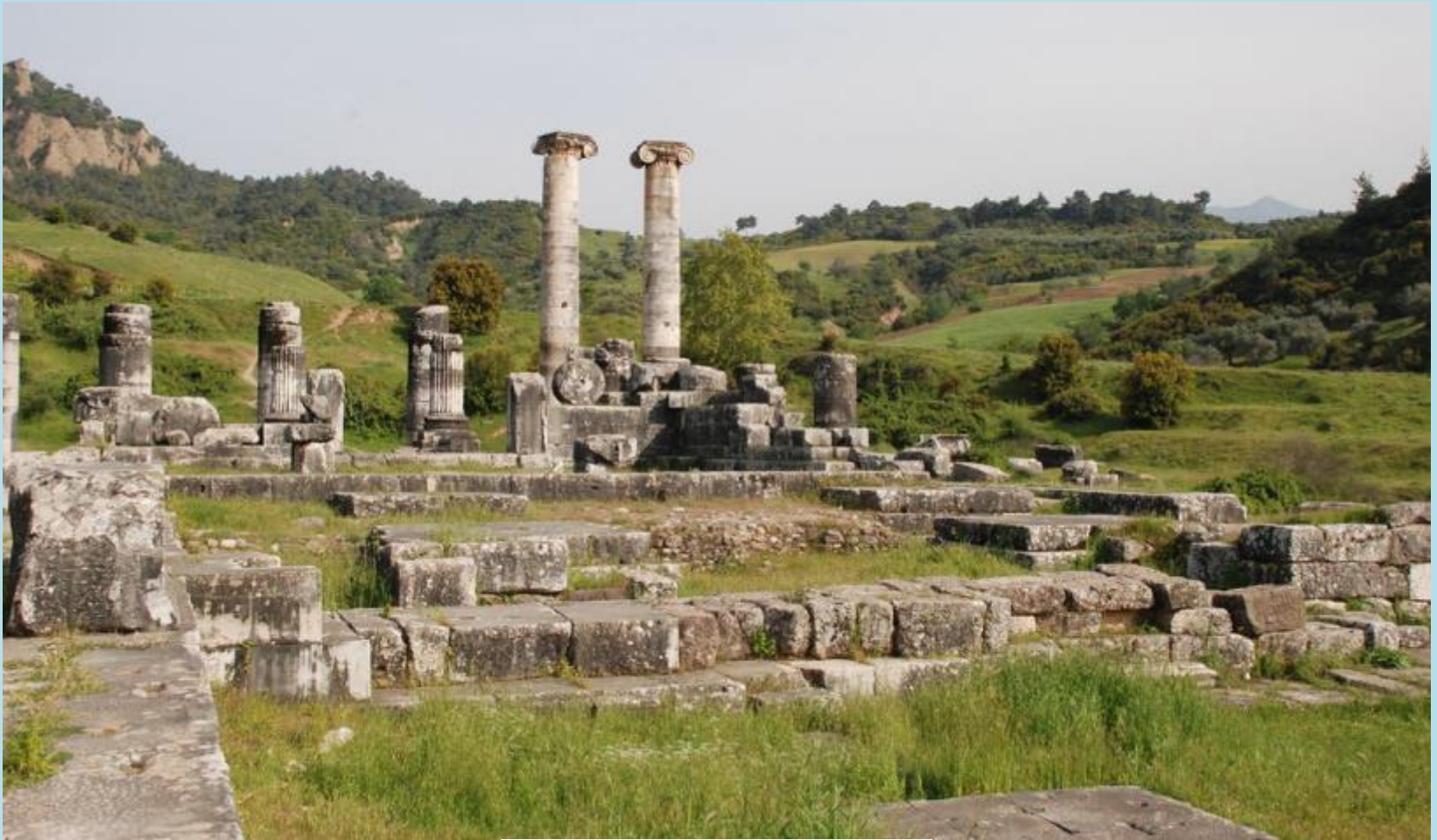
Temple of Artemis at Sardis