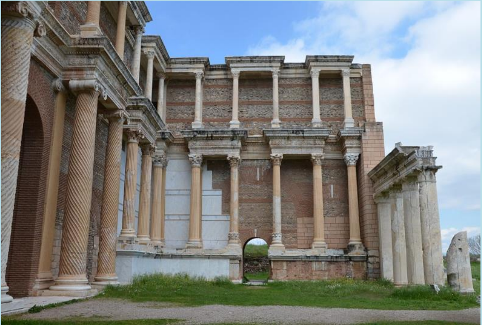
Details of the Gymnasium complex.