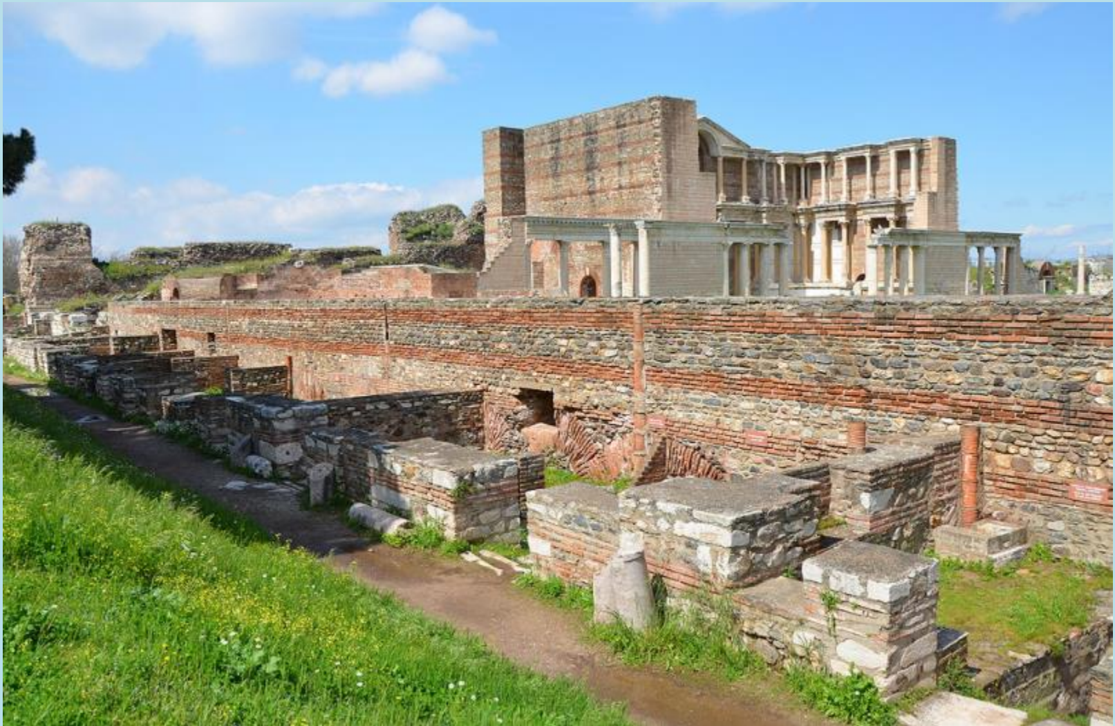
Remains of the Greek Byzantine shops and the Bath-Gymnasium Complex in Sardis