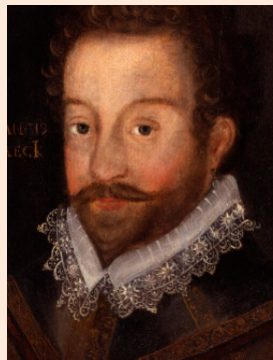
A prayer by Francis Drake 1577